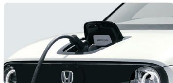
①給電コネクタを差す