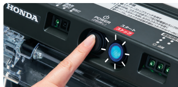
②電源スイッチON→スタートスイッチON