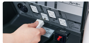
③コンセントに電気機器のプラグを差して使う